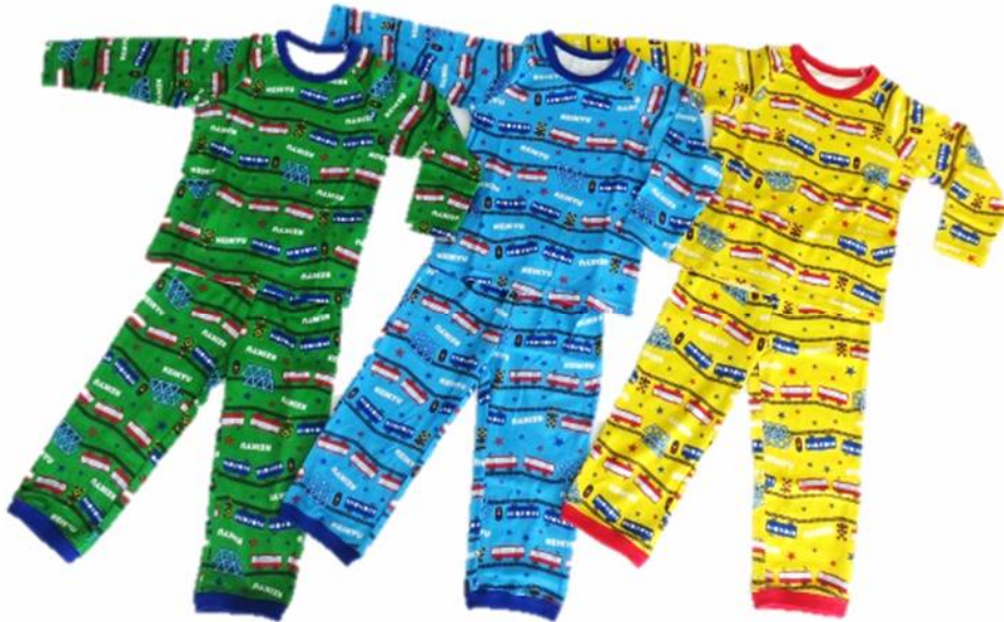
(1) けいきゅうキッズパジャマ