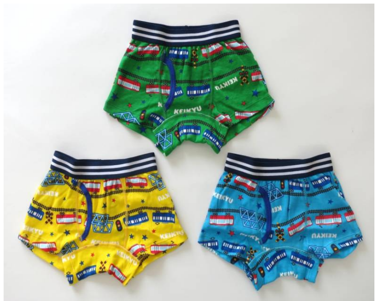
けいきゅうキッズ ボクサーパンツ