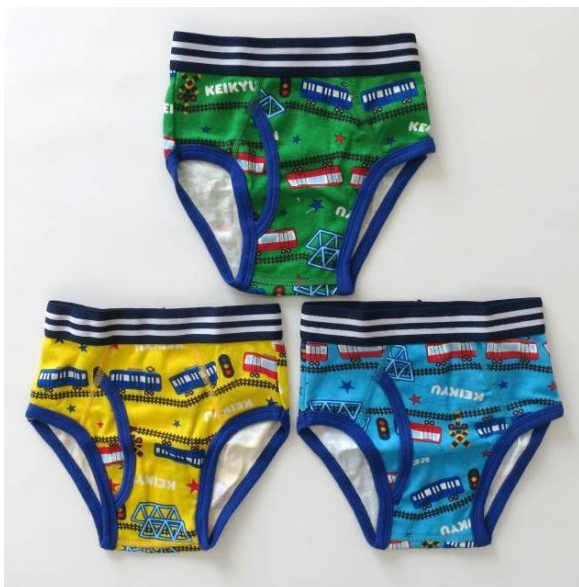
けいきゅうキッズ ブリーフパンツ